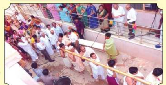
ધ્વજ ઢંડની પ્રદક્ષિણા ▶