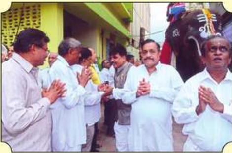
રથયાત્રાનો રાજસ્થાની દેરાસરમાં પ્રવેશ