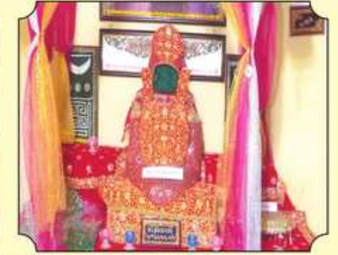
પ.પૂ.સા.શ્રી જય દર્શિતાશ્રીજી મ.સા. તથા પ.પૂ.સા.શ્રી દિમાંસુશ્રીજી મ.સા. દ્વારા ઢાઢાશ્રીનો રાણગાર