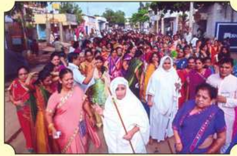
રથ યાત્રા દરમિયાન મહિલાવૃંદ સાથે પૂ.સાધ્વીજી મ.સા.