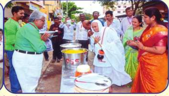
સ્થાનિક લોકોને ભોજન દરમિયાન પુ. સાધ્વીજી દ્વારા આશીર્વાદ