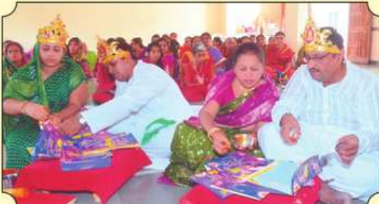
◀ આમંત્રણ પત્રિકામાં લિખિતંગના લાભાર્થી પરિવાર: માતૃશ્રી જવેરબાઈ વિરજી પાલણ ગાલા પરિવાર દ્વારા કુમકૂમ છાંટણા