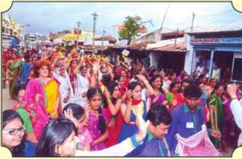
રથ યાત્રા દરમિયાન કળસ સાથે મહિલાઓ