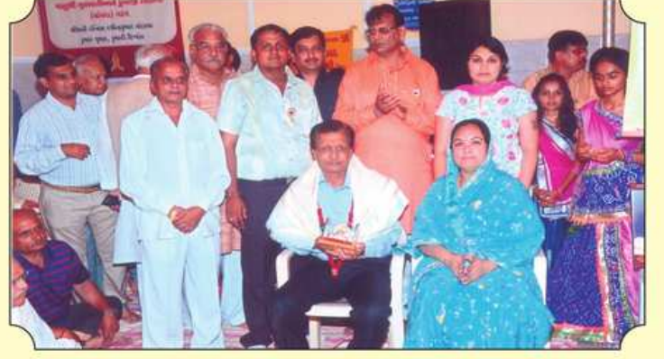
રંગ મંડપની ધજાનાં લાભાર્થીઓનું સન્માન