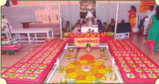
૧૦૮ પાર્શ્વનાથ પૂજન