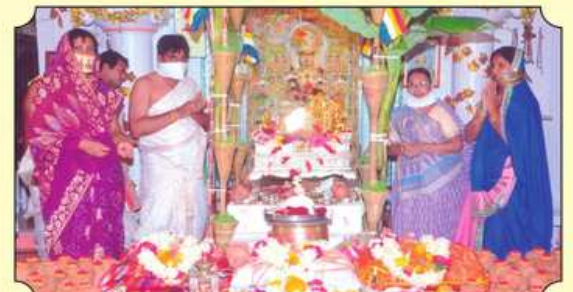
બૃહત્ શાંતિ સ્નાત્ર પૂજન ▶