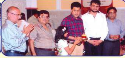
સ્થ યાત્રામાં હાજર રહેલ મુંબઈ મહાજનનાં પદાધિકારીઓ