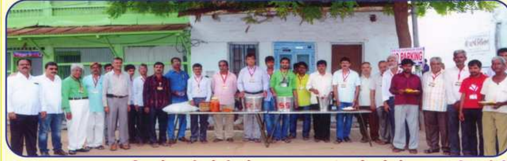
સ્થાનિક રહેવાસીઓની ભોજન વ્યવસ્થાનાં કાર્યકર્તાઓ