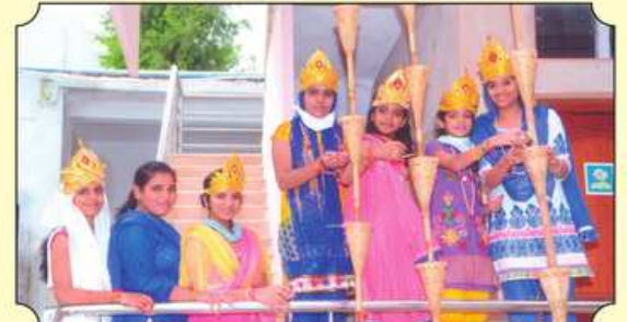
જ્વારા રોપણ ▶