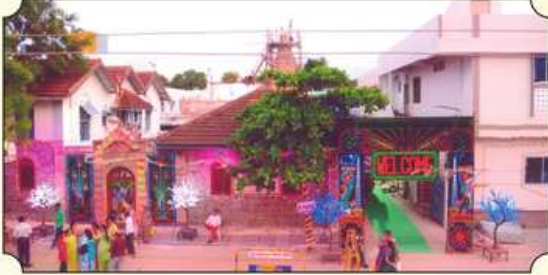
વારાણસી નગરી તથા દેરાસરનાં આગળના ભાગનો શણગાર