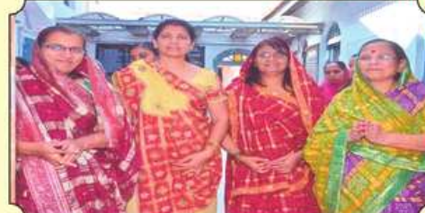
પૂજ્યશ્રીનાં નગર પ્રવેશ વખતે ગહૂલી માટે તૈયાર બહેનો