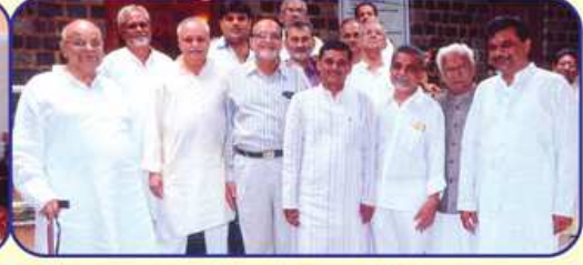
બહારગામથી પધારેલ મહાનુભાવો