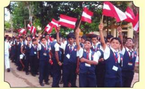
રથ યાત્રા દરમિયાન આપણી શાળાનાં વિદ્યાર્થીઓ