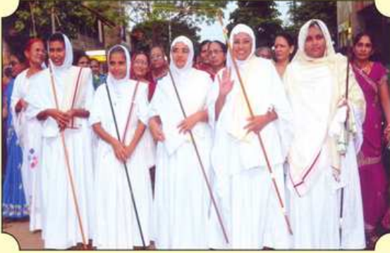
◀ રથયાત્રા દરમિયાન પૂજ્યશ્રીઓની હાજરી