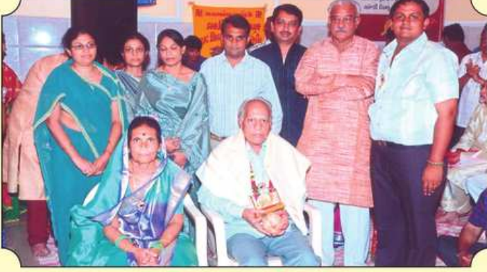
ક્ષેત્રપાલની ધજાનાં લાભાર્થીઓનું સન્માન