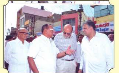
રથયાત્રા દરમિયાન મહાનુભવાઓ