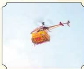
હેલીકોપ્ટર દ્વારા પુષ્પવૃષ્ટિ