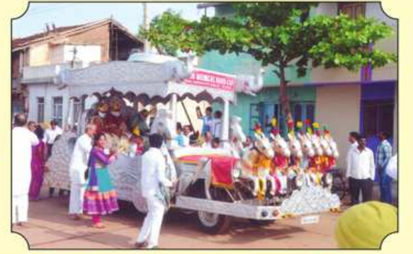
શોભા યાત્રા ▶ દરમિયાનનો રથ