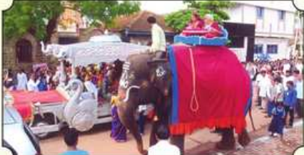
સ્થયાત્રા દરમિયાન ગજ ઉપર ધ્વજ સાથે લાભાર્થી પરિવાર