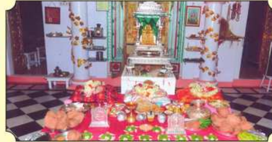
અઢાર અભિષેક પૂજન