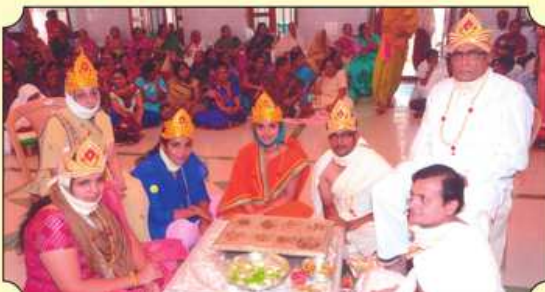
◀ દશ દિક્પાલ પૂજન