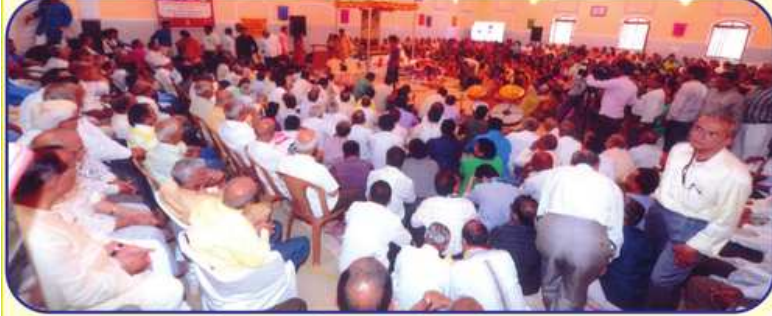
મહોત્સવ દરમિયાન રાત્રે ભક્તિભાવના

ચંદા રે મારા વીરાને કહેજો બેનો યાદ કહેવો કરે હો પ્રથમ પુણ્યતિથિએ અશ્રુપુરીત શ્રધ્ધાંજલિ