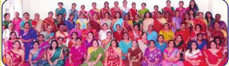
શતાબ્દી મહોત્સવ પ્રસંગે પધારેલ ગઢગની દીકરીઓ (નિયાણીઓ)