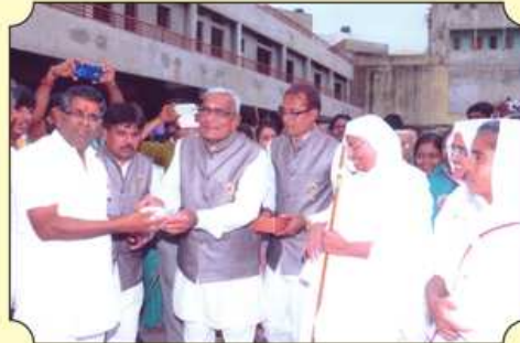
રાજસ્થાની દેરાસરમાં વાસન્નેપની ચાંદીની ડબ્બી અર્પણ