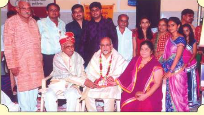
મુખ્ય ધજાનાં લાભાર્થીઓનું સન્માન