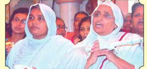
પૂજ્યશ્રી દ્વારા શ્રી ચિંતામણી પાર્શ્વનાથ ભગવાનને આમંત્રણ એવમં પત્રિકા અર્પણ